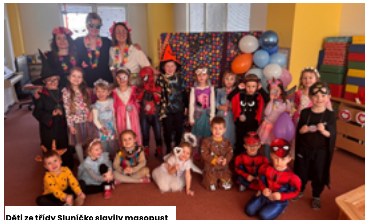
Děti ze třídy Sluníčko slavily masopust