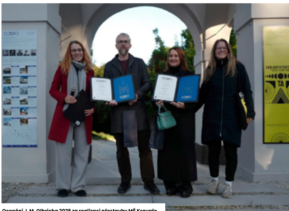
Ocenění J. M. Olbricha 2025 za realizaci přestavby MŠ Kravaře