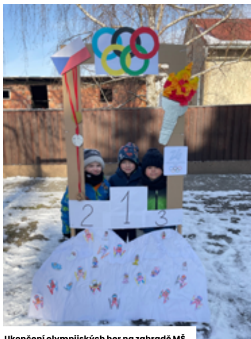
Ukončení olympijských her na zahradě MŠ