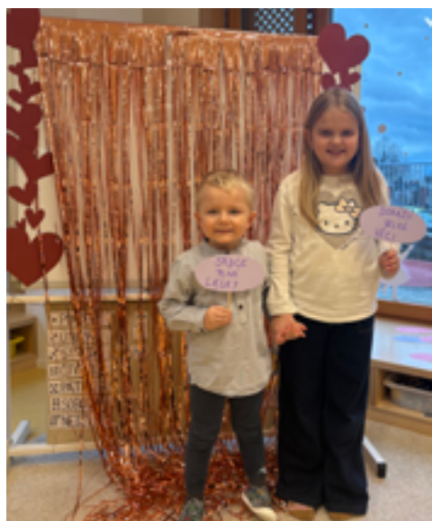
Valentýnské odpoledne ve třídě Kuřátko