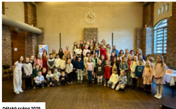
Dětská scéna 2026