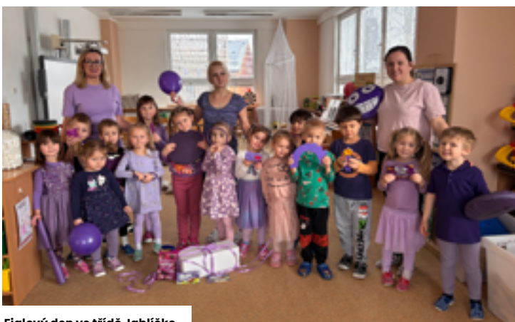
Fialový den ve třídě Jablíčko