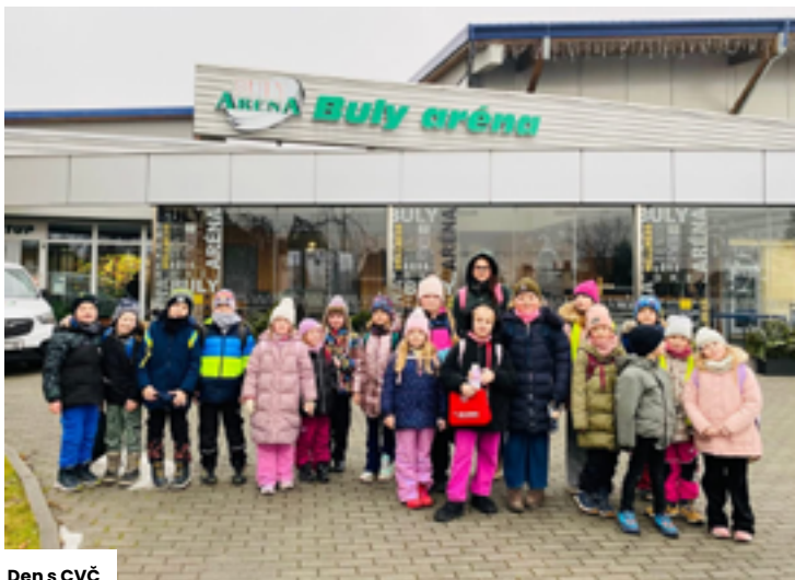
Den s CVČ