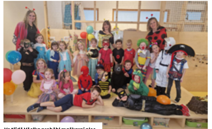
Ve třídě Včelka proběhl maškarní ples