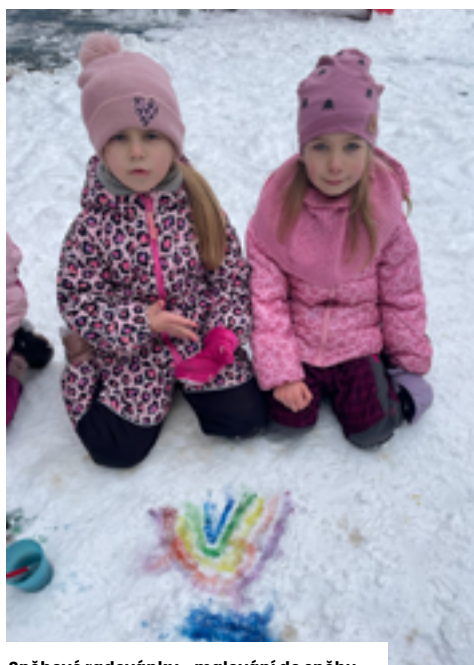
Sněhové radovánky - malování do sněhu