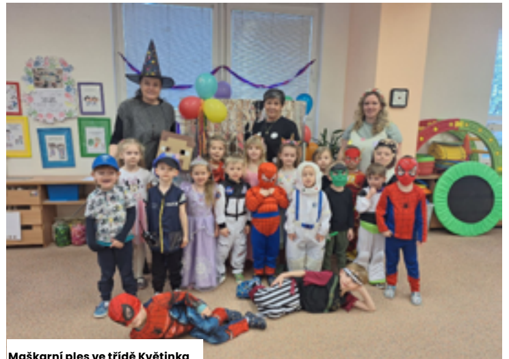
Maškarní ples ve třídě Květinka