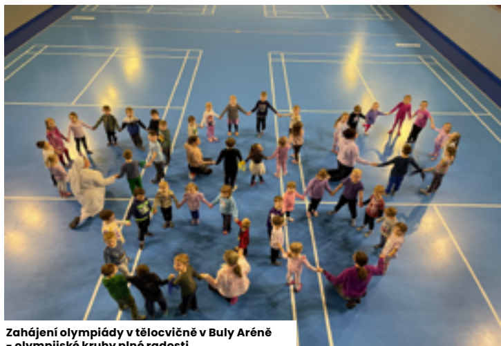
Zahájení olympiády v tělocvičně v Buly Aréně - olympijské kruhy plné radosti