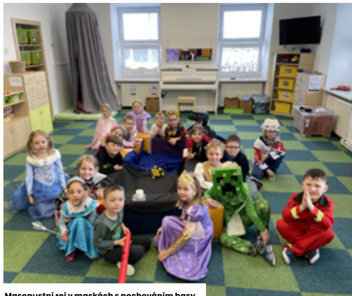
Masopustní rej v maskách s pochováním basy