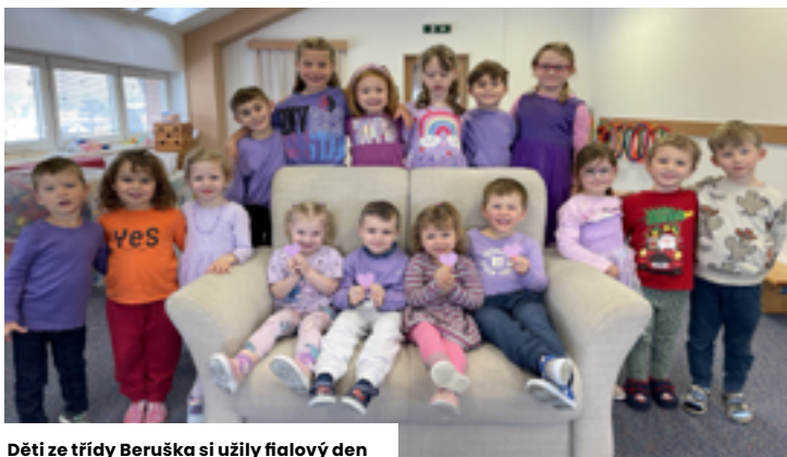
Děti ze třídy Beruška si užily fialový den