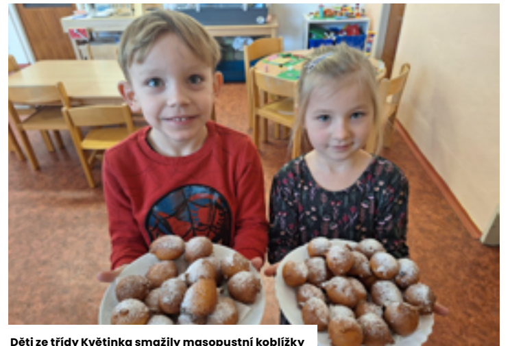
Děti ze třídy Květinka smažily masopustní koblížky