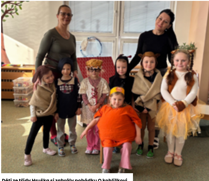
Děti ze třídy Hruška si zahrály pohádku O koblížkovi