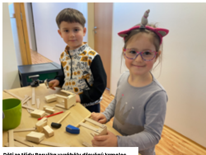
Děti ze třídy Beruška vyráběly dřevěný krmelec