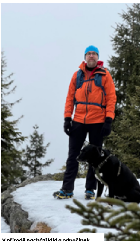
V přírodě nachází klid a odpočinek

vymýšlel technologii na speciální subtilní betonové konstrukce a následně jsme vyráběli designové doplňky, světla atd. Měli jsem s tím i úspěch, nicméně jsme oba dali přednost našim profesím. Taký rád relaxuju vařením a sportem. Jsem individualista, týmové sporty mě stresují, takže nehraju hokej ani fotbal. O to raději jezdím na kole, lyžích, snowboardu a chodím po horách. Ze všeho nejraději ale cestuju a rád poznávám neturistickým způsobem kulturu a přírodu celého světa. Baví mě nízkonákladové dobrodružné výlety.