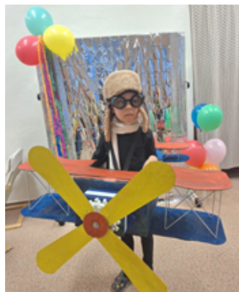
Maškarní ples ve třídě Květinka