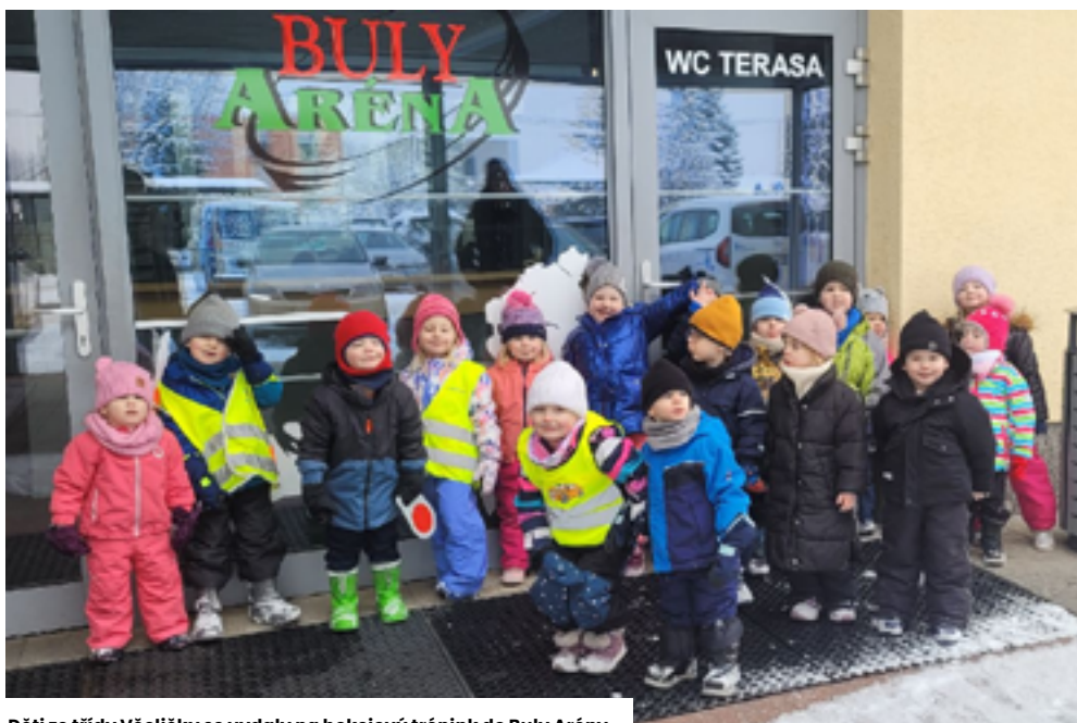
Děti ze třídy Včelíčky se vydaly na hokejový trénink do Buly Arény