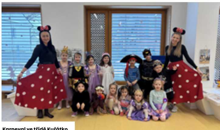
Karneval ve třídě Kuřátko