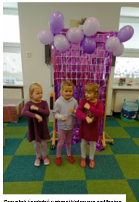
Den plný úspěchů v rámci týdne pro wellbeing