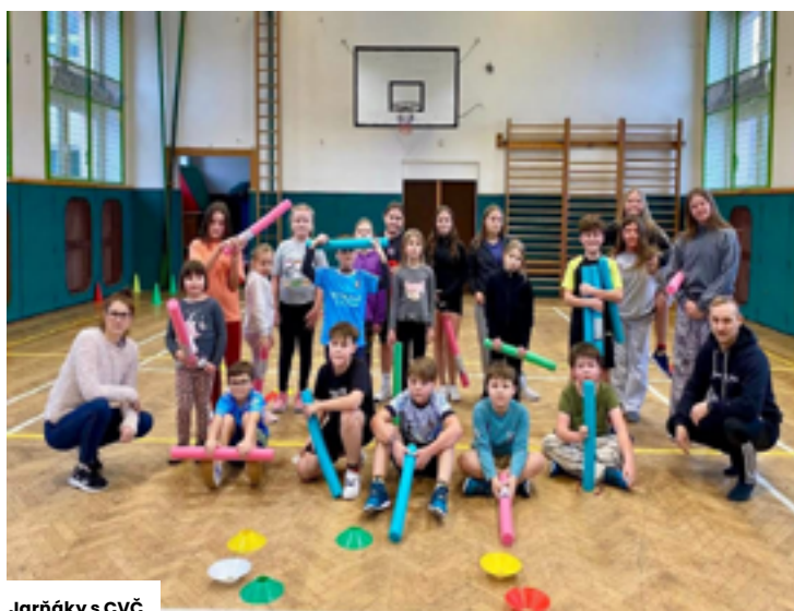
Jarňáky s CVČ