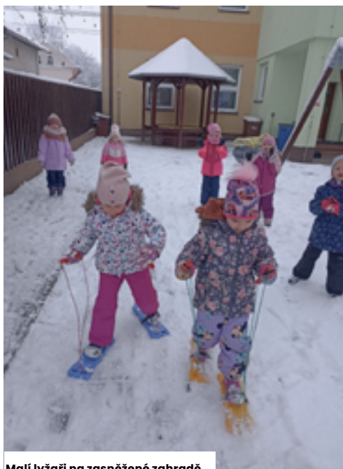
Malí lyžaři na zasněžené zahradě