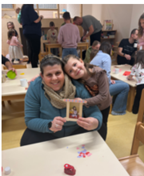
Valentýnské odpoledne ve třídě Kuřátko